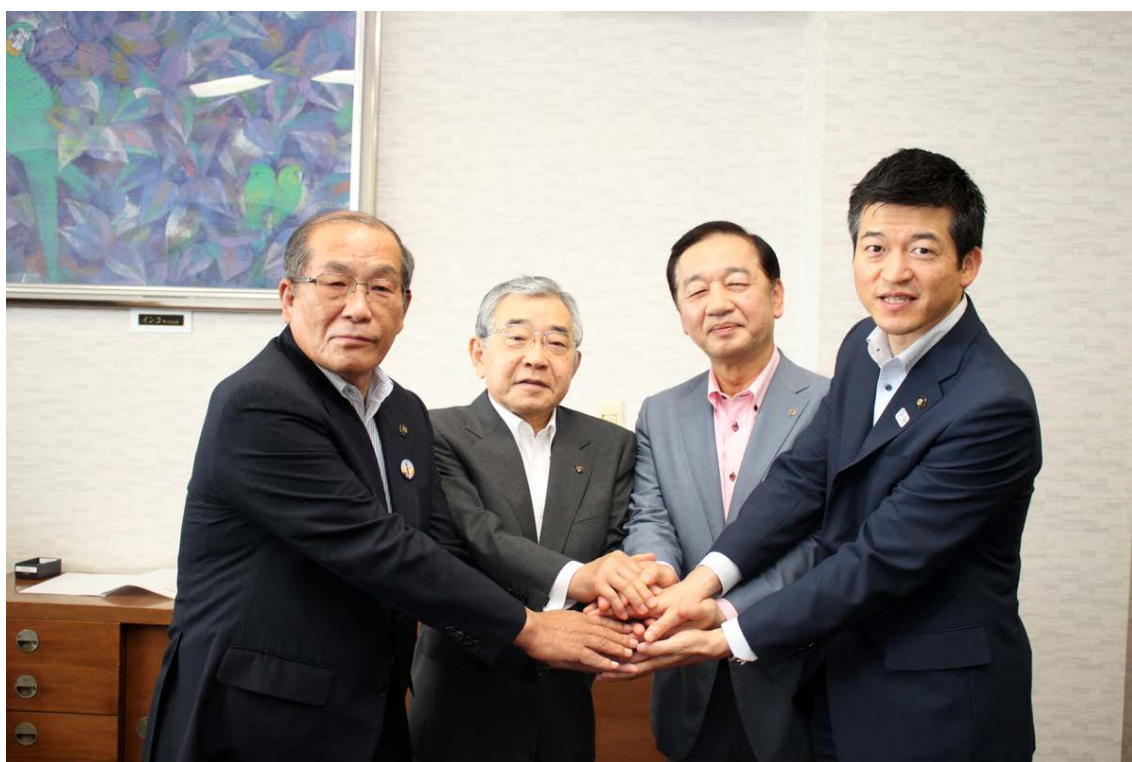
左から、長岡出雲市長、溝口島根県知事、弊社社長、山本益田市長